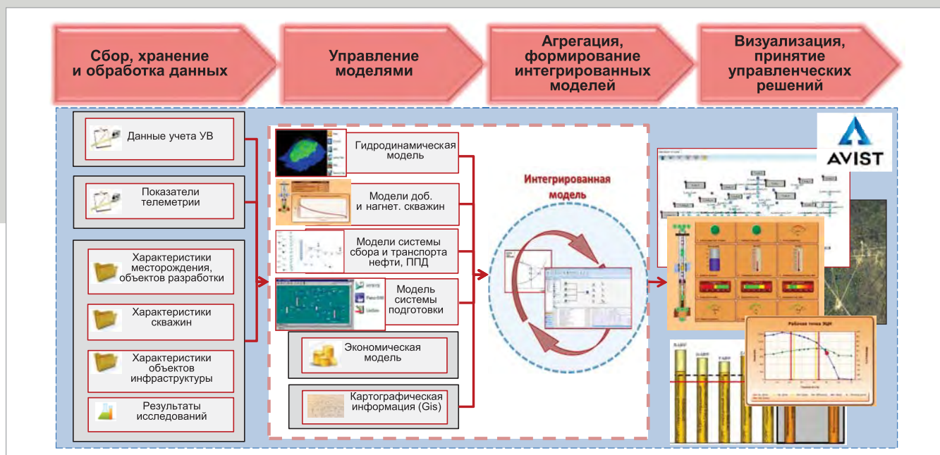
Рис. 3. Роль и место платформы AVIST в построении «цифрового месторождения»

Актуальность и наглядность данных, предоставляемых AVIST, позволяют принимать решения по оптимизации отдельных элементов производственной цепочки и всего месторождения в целом (рис. 3).